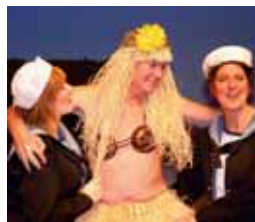
Billeder fra forestillingen "South Pacific" - november 2009

Syng, spil, dans - og vær glad - sammen med andre.