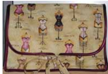
Lotte Harth Watson

F 02 314 18/9, 2/10, 30/10, 13/11 og 27/11